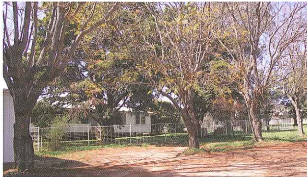
건데어 시골 농장 임시 간호 서비스 센터

간호인이란 정기적 또는 지속적인 간호를 무상으로 제공하는 사람을 의미합니다.