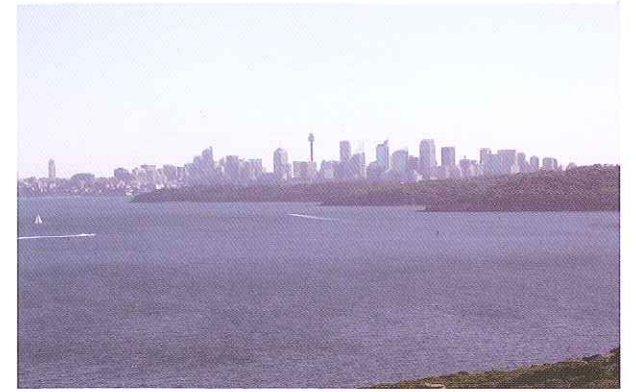
생츄어리 임시 간호 서비스 센터