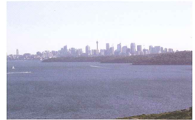
Sanctuary Respite Centre