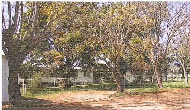
Gundair Rural Homestead Respite Centre

Un cuidador es una persona que brinda cuidado y atención en forma regular o continua a otra persona sin que medie pago por su papel de cuidador.